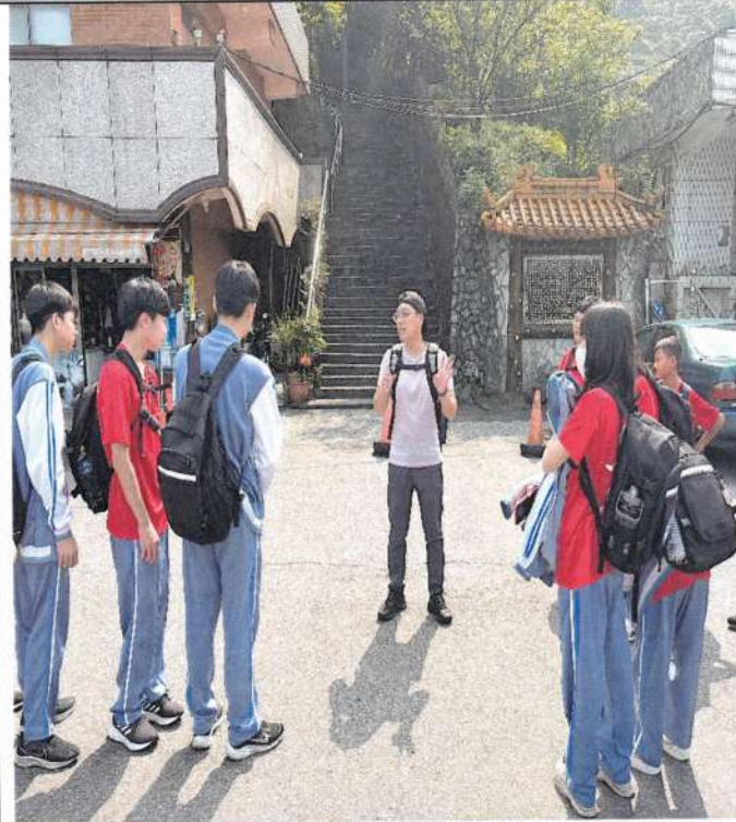
照片說明：登山前教師提醒注意事項