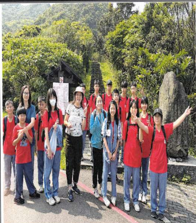
照片說明：校長與家長一同來參與山野教育課程