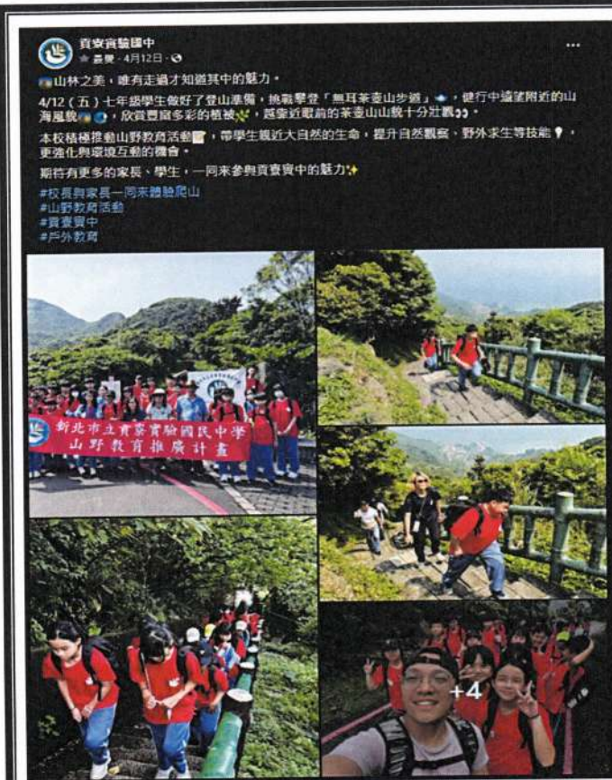
照片說明：將七年級成果推廣至學校臉書專頁