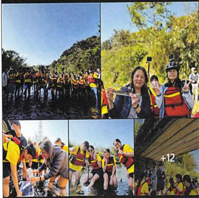
照片說明：將八年級山林、溪流生態觀察課程推廣至學校臉書專頁

希望藉由 #里川生態課程，讓學生能更認識身邊的這片土地，未來可以由內心愛護自然生態，為環境保護貢獻一分心力。