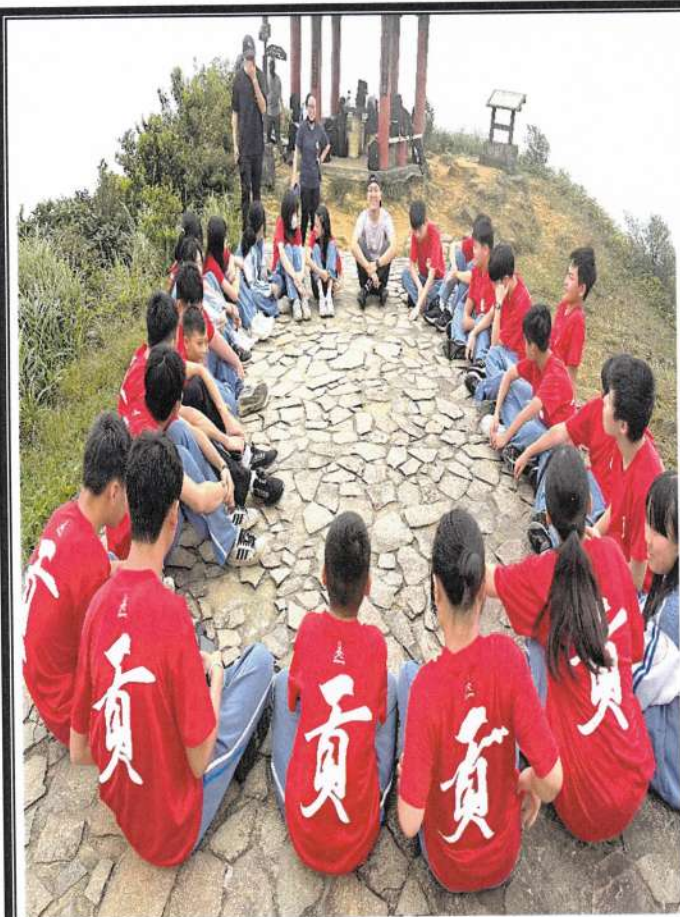
照片說明：在山上進行活動反思、探討步道問題