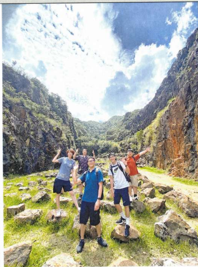
照片說明：山野教育教師社群成員