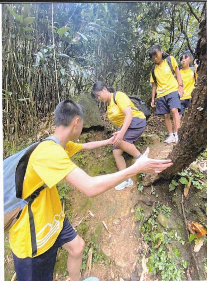
照片說明：在行進間學生展現團隊合作的精神