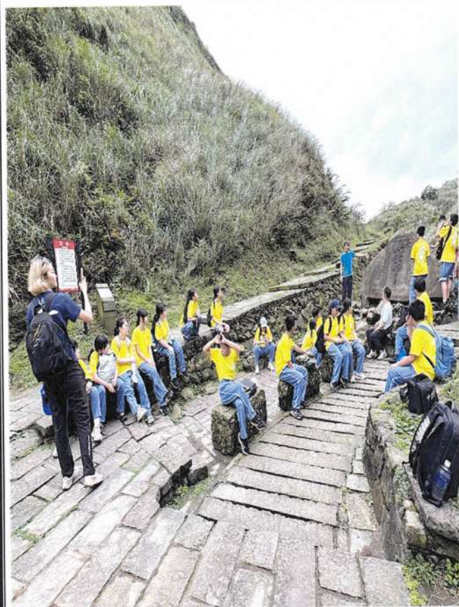
照片說明：教師介紹古道遺跡的歷史文化