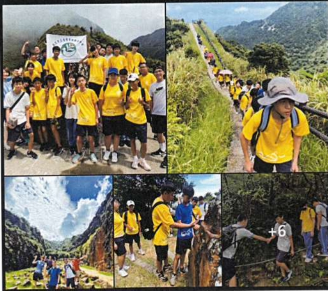
照片說明：將九年級成果推廣至學校臉書專頁